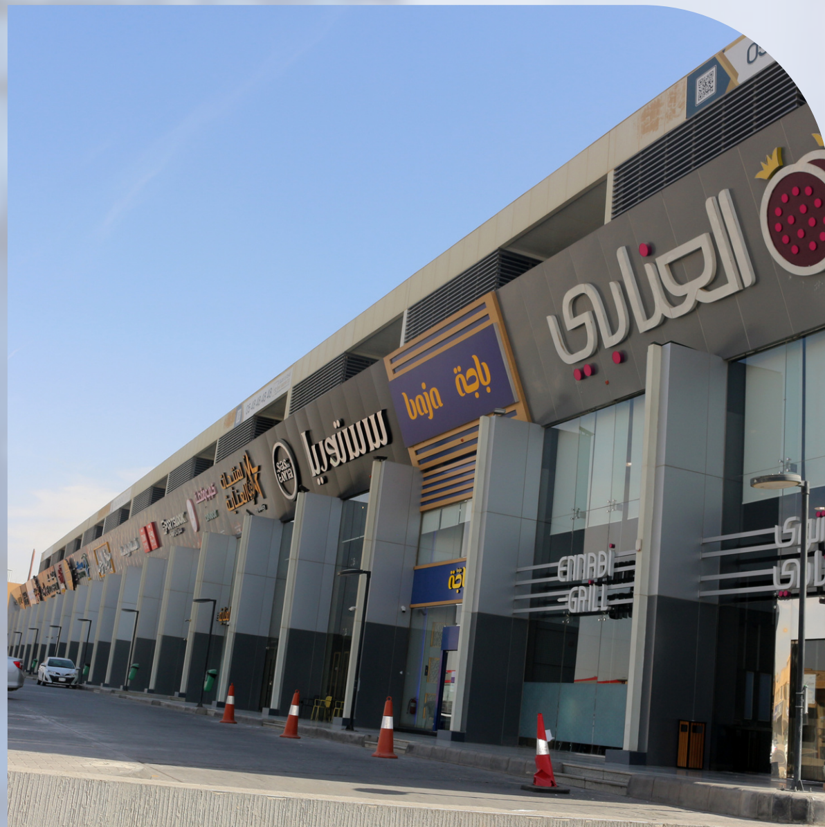
AL - HATHLOUL COMPANY