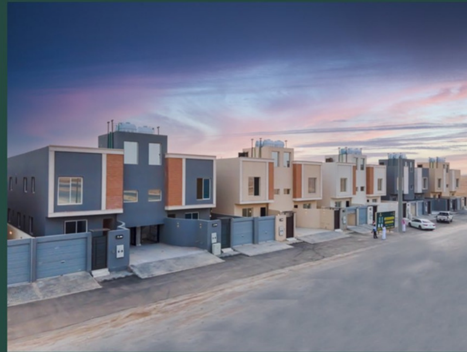
لافتير آل متعب الجنادرية

L'AVENIR PROJECT - RIYADH AL-REHAB NEIGHBORHOOD