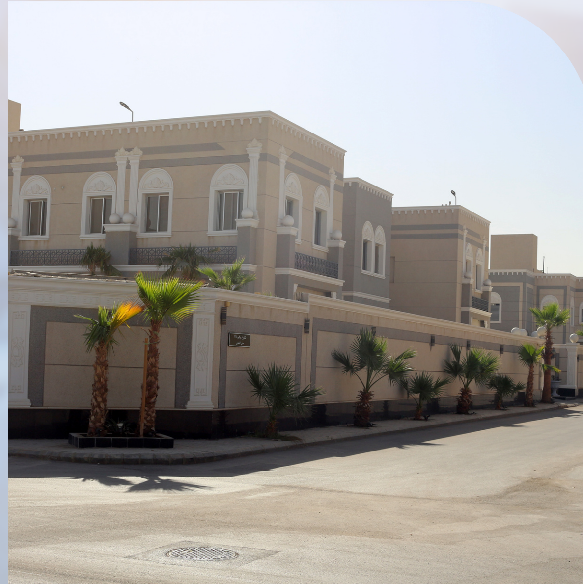
مجمع فلل العلولة