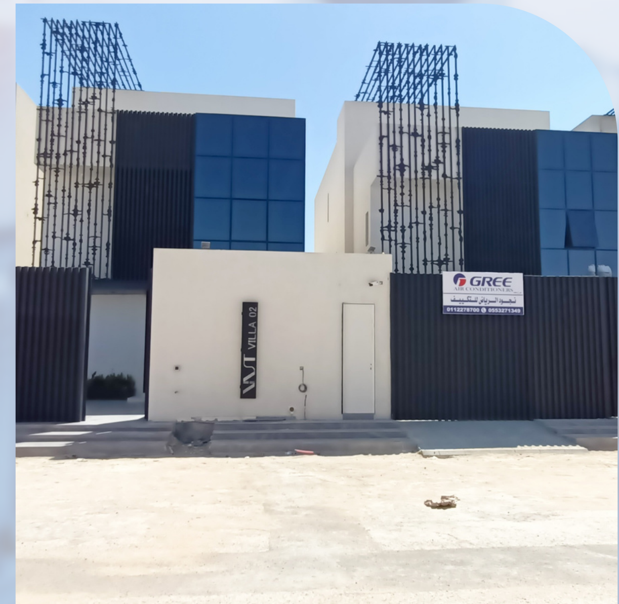
VILLAS COMPLEX - OLAYA DISTRICT