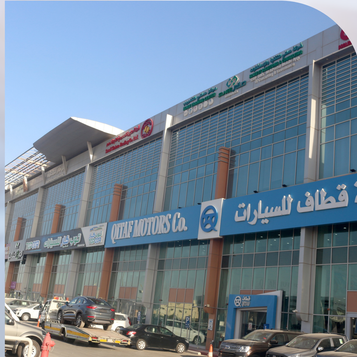
شركة ذيبان والعايد