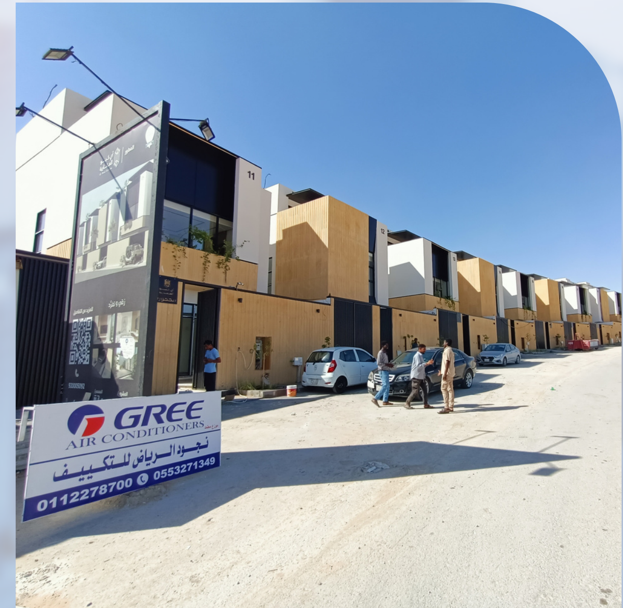
RAV VILLA COMPOUND - 20 VILLAS - AL-ARID DISTRICT