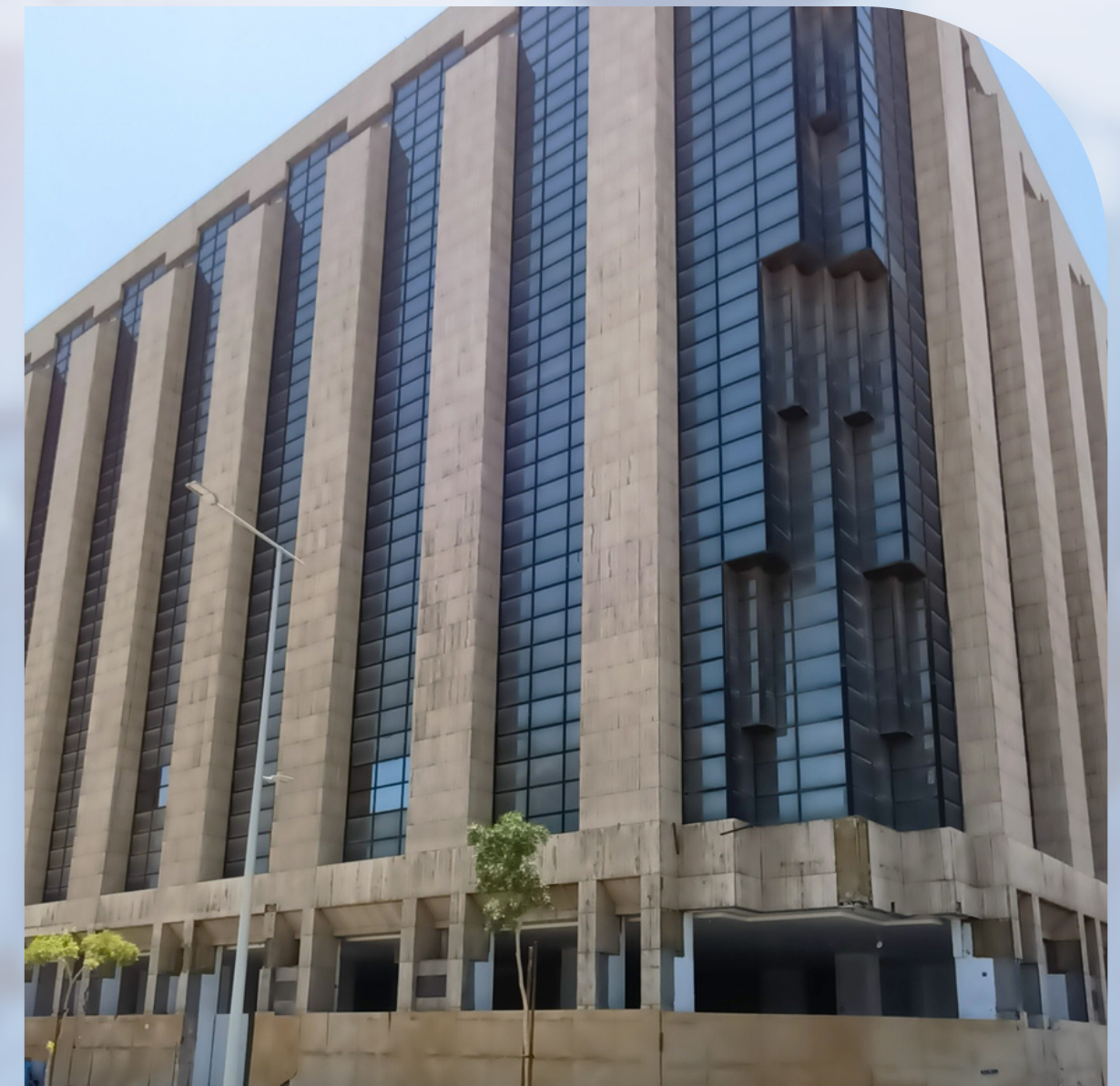
COMMERCIAL RESIDENTIAL TOWER