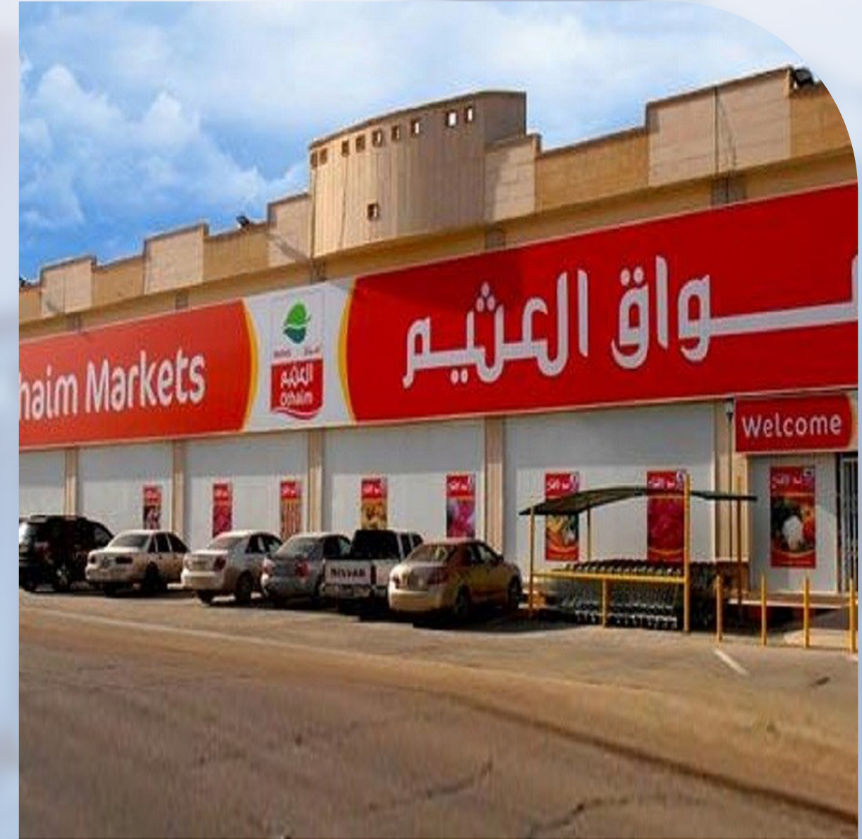
شركة اسواق العثيم