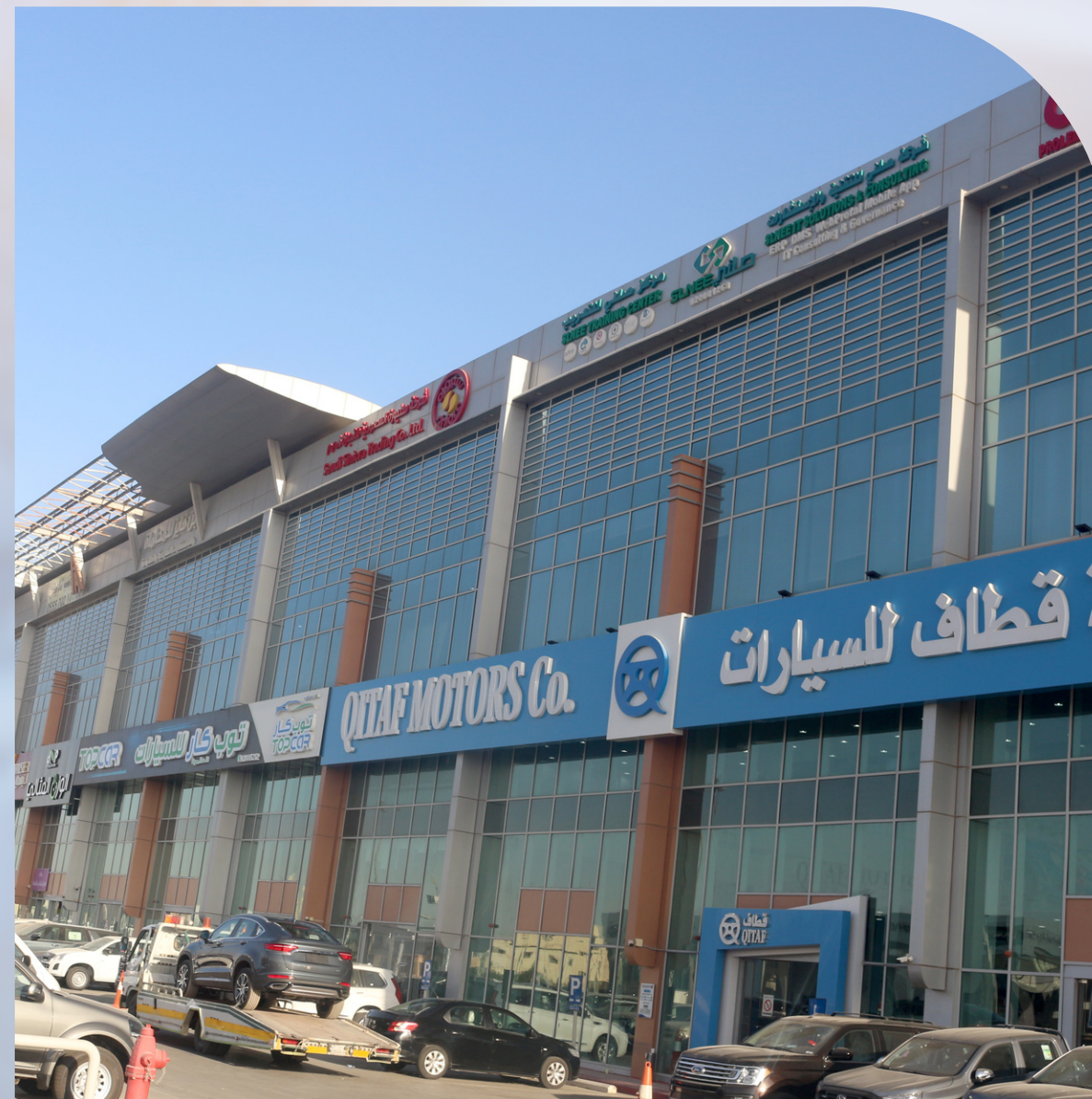
THEBAN AND AL - ABED COMPANY