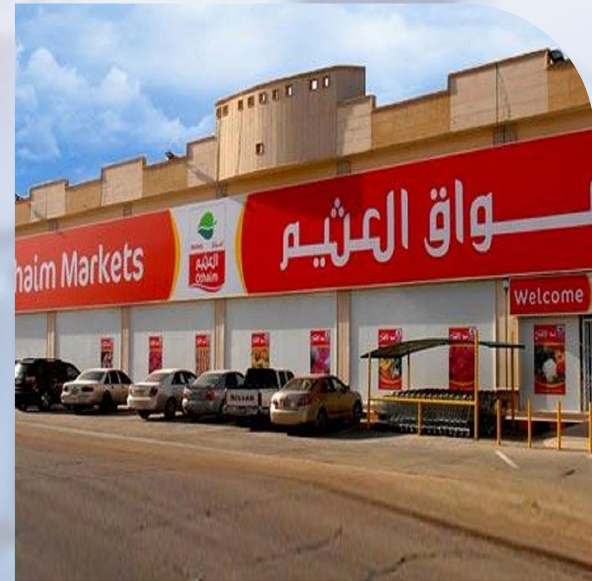
OTHAIM MARKETS COMPANY