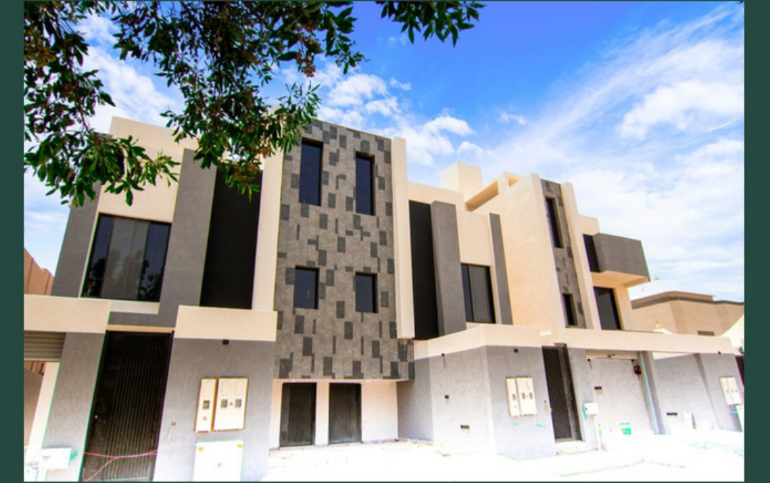
لافتير آل متعب الروضة