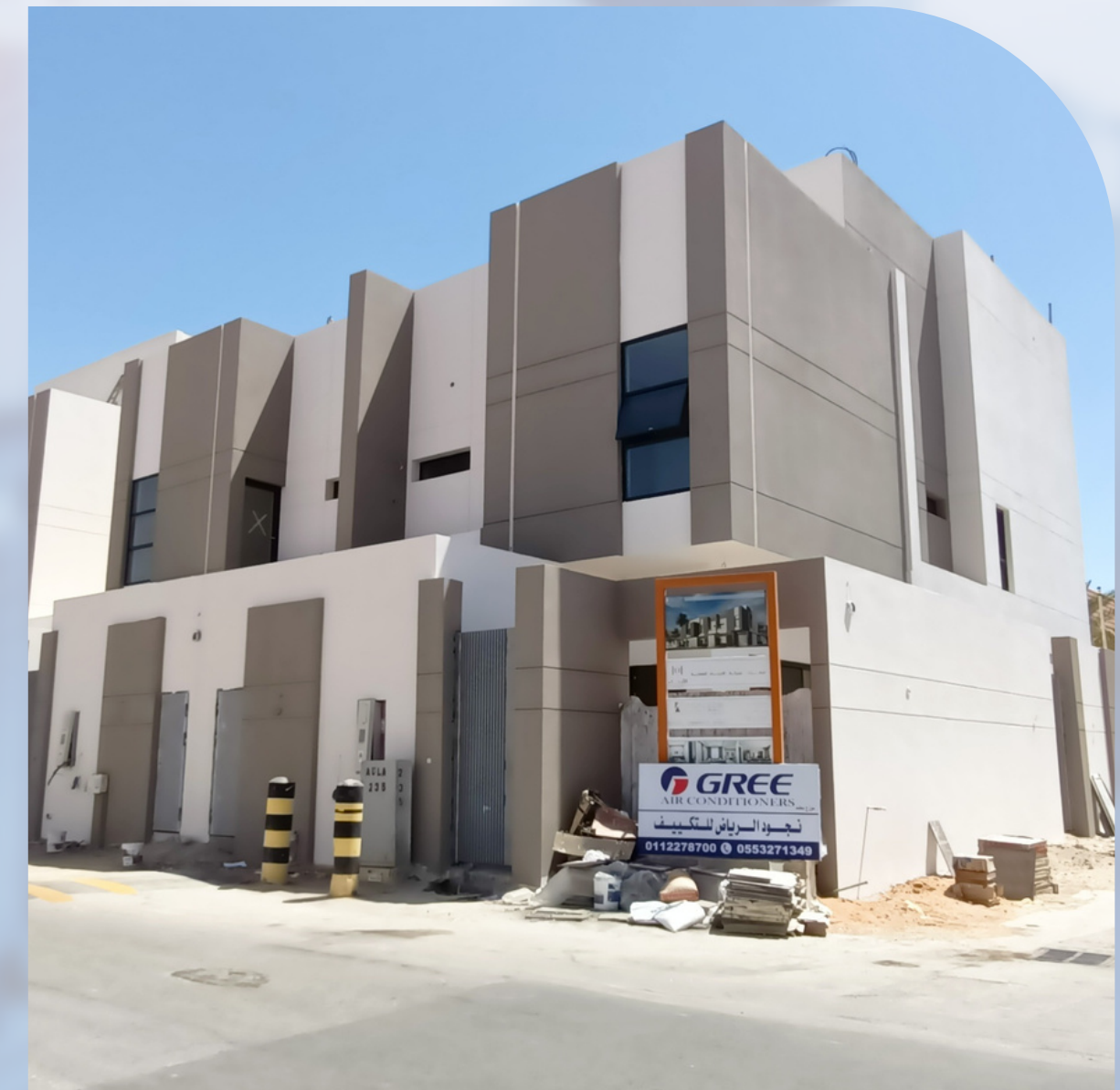
VILLAS COMPLEX - OLAYA DISTRICT