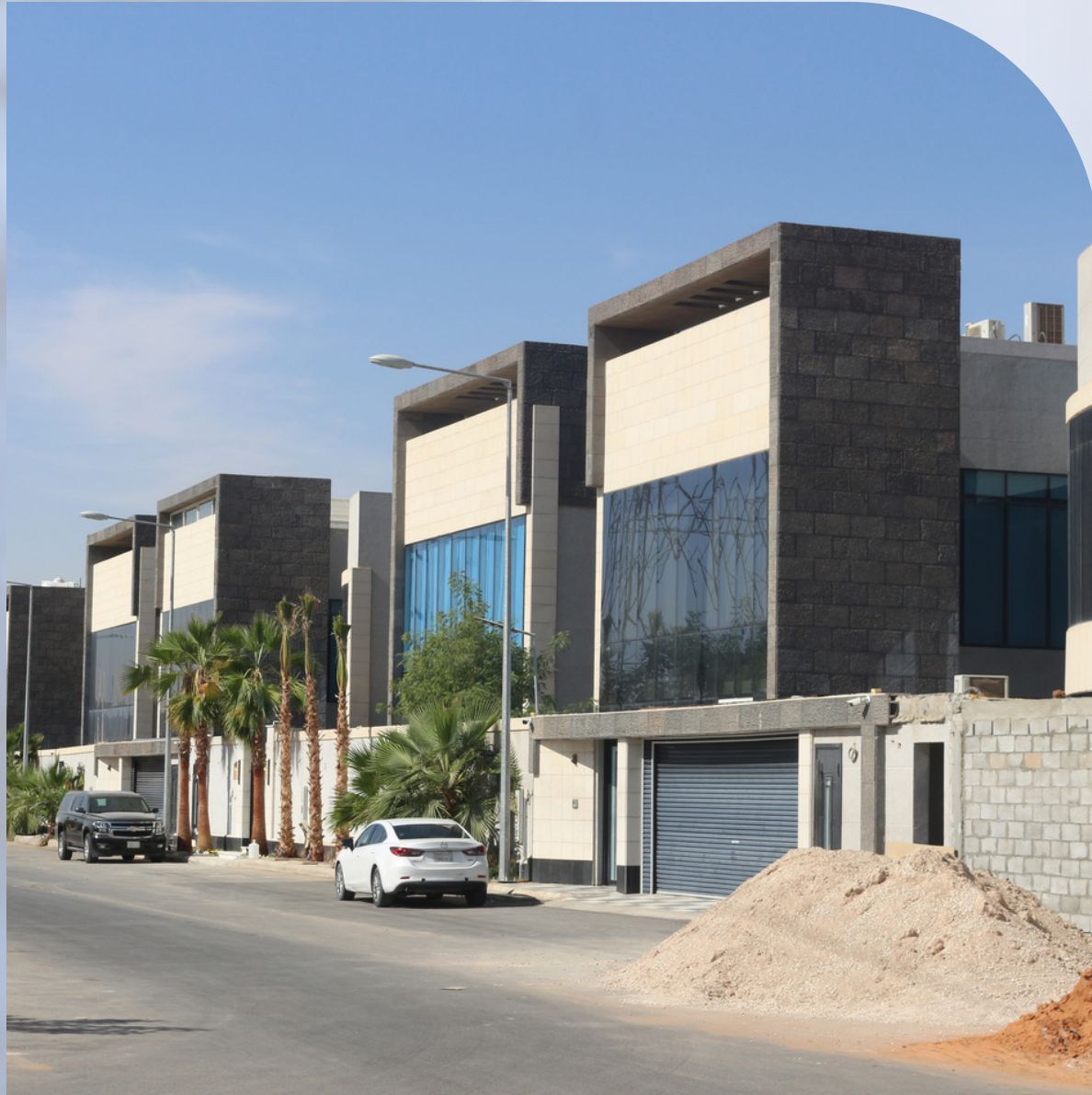
مجمع فلل الراجحي