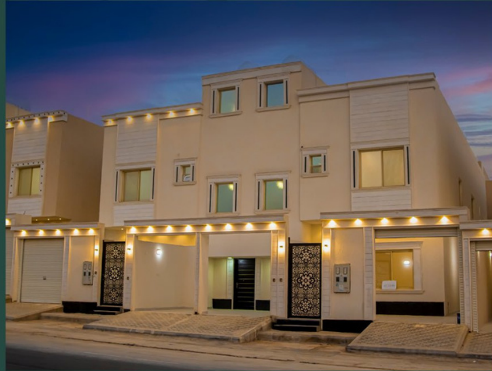
لافتير آل متعب الرحاب